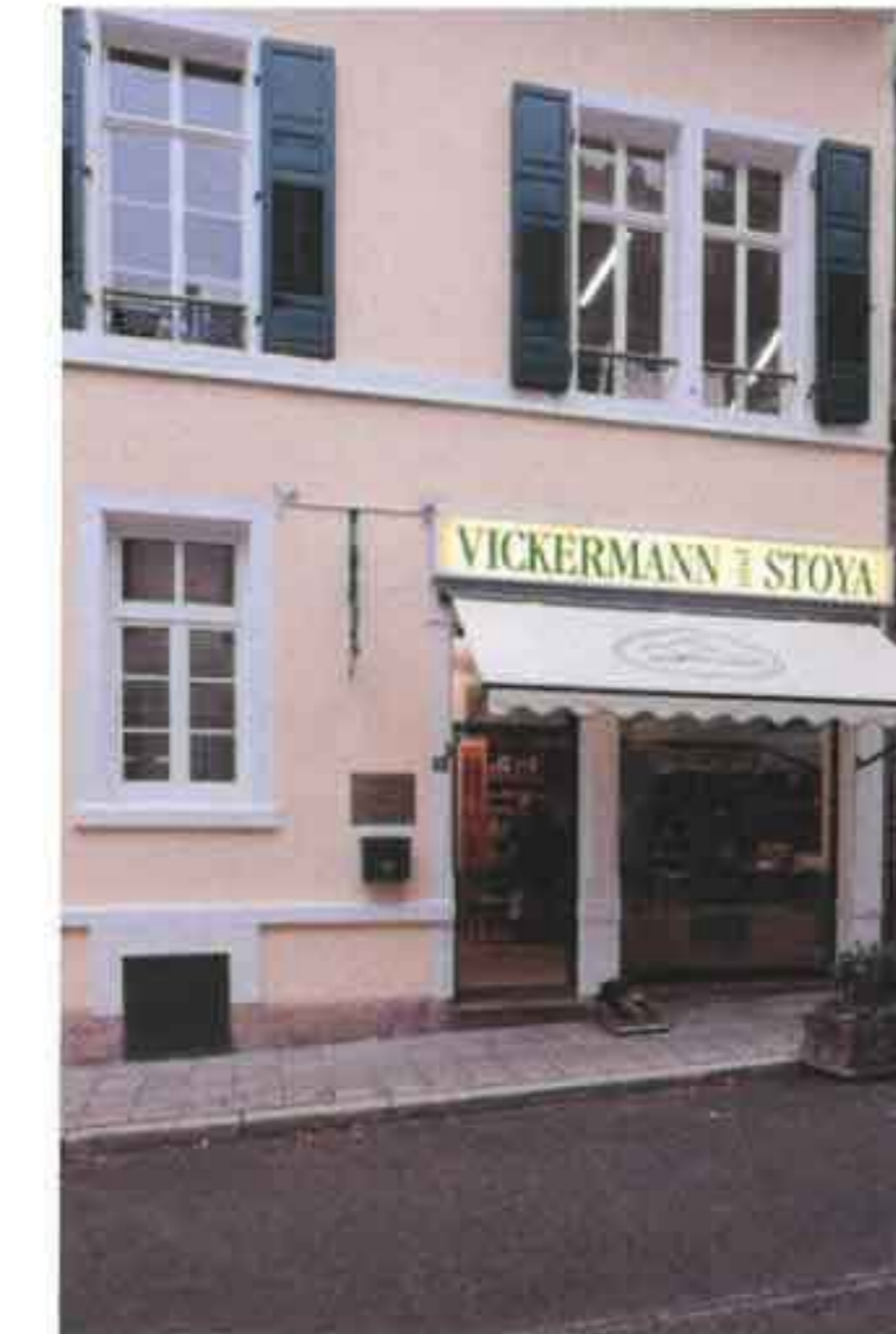
Die Vickermann und Stoya Maßschuhmanufaktur mit Sitz in der traditionsreichen Bäderstadt

von Aal oder Perlrochen. Das Leder des Perlrochens ist eine Rarität. In seiner Reiß- und Reibfestigkeit übertrifft es alle anderen Leder, denn die ungeheuer dichte Perlenstruktur der Hornschicht macht es unverwundlich. Entsprechend ist die Verarbeitung, der Gerbungsprozess, eine technisch schwierige und sehr zeitaufwendige Angelegenheit. Doch diese Herausforderung nimmt die Vickermann & Stoya